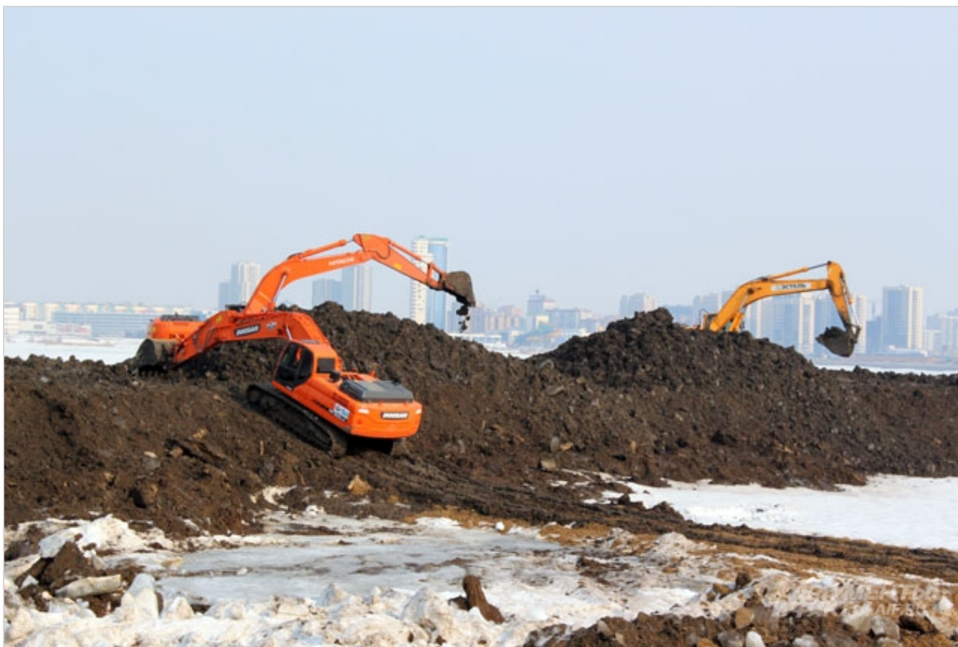
Канал на Казанке обустраивают к лету.

Сейчас на данной территории осуществляются работы по углублению реки.