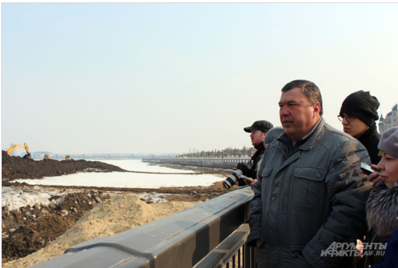
Журналистам рассказали о благоустройстве берега.

«Регулярно в середине лета они появляются. На черных островах сидят чайки и выглядит это не очень красиво. Поэтому их нужно поднять до 55-й отметки. Засадим участки травой. Зеленые острова будут восприниматься гражданами как лужайки».